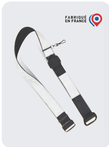
/ CPAR CEINTURON PORTE ACCESSOIRES RETRO

Ceinturon de feu porte accessoires et liaison du pompier à la "ligne de vie".