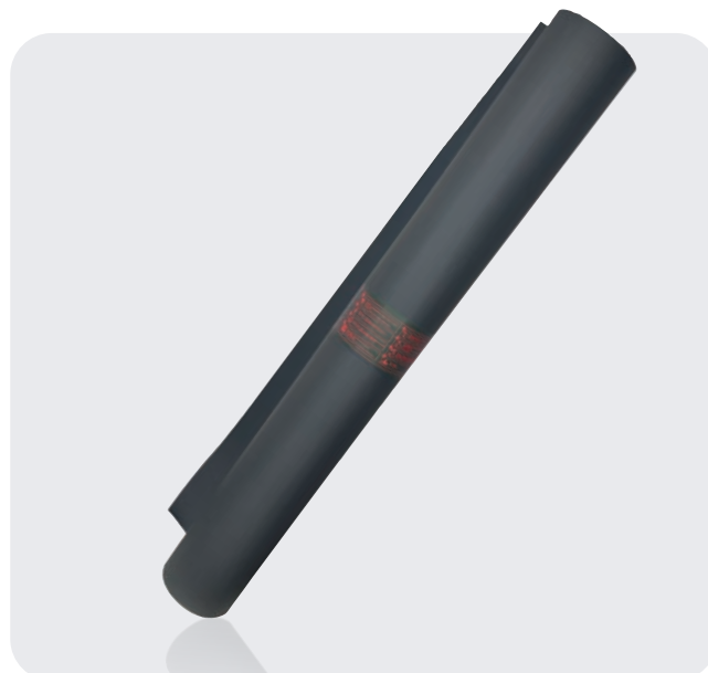
/ RBCL TAPIS ISOLANT (CLASSE 0, 2, 3 & 4) CEI 61111: 2009

Gants isolants composites pour travailler en toute sécurité sans surgants cuir Opération de maintenance à risque mécanique élevé