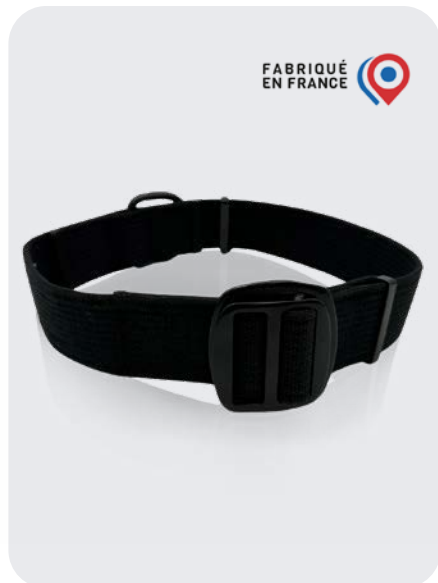
/ CPA CEINTURON PORTE ACCESSOIRES