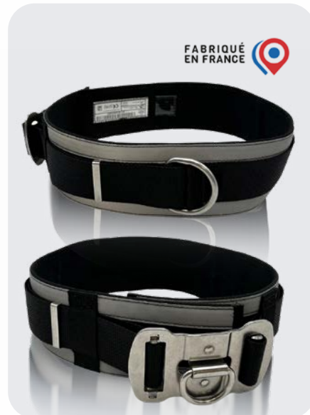
/ CI-326-2 CEINTURON D'INTERVENTION

Ceinturon de feu porte accessoires et liaison du pompier à la "ligne de vie".