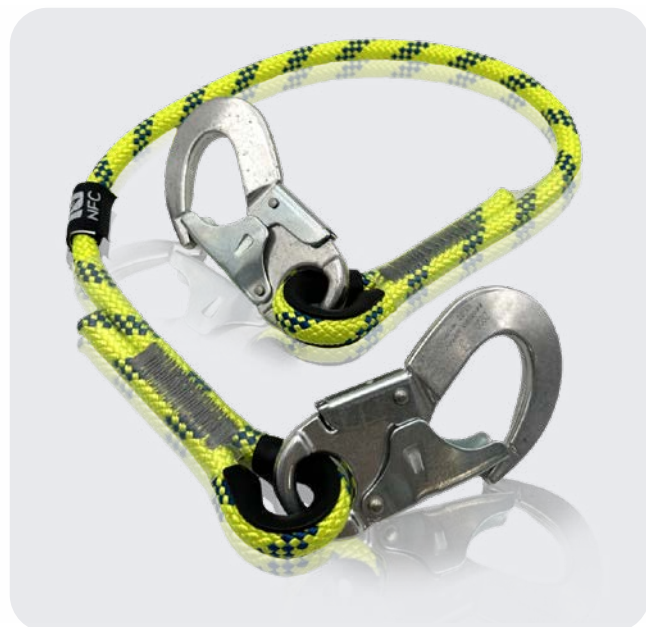
/ LC-HVO-100 & LC-HVJ-100 LONGE D'INTERVENTION FIXE 1M EN 354

Ceinture de retenue conforme EN 358: 2018.