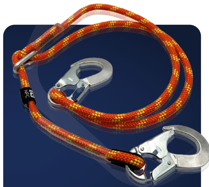
/ LCR-HVO-180 & LCR-HVJ-180 LONGE D'INTERVENTION RÉGLABLE 1,80 M EN 354 ET EN 358

Longe d'assujettissement fixe utilisée lors des interventions sapeur-pompiers.