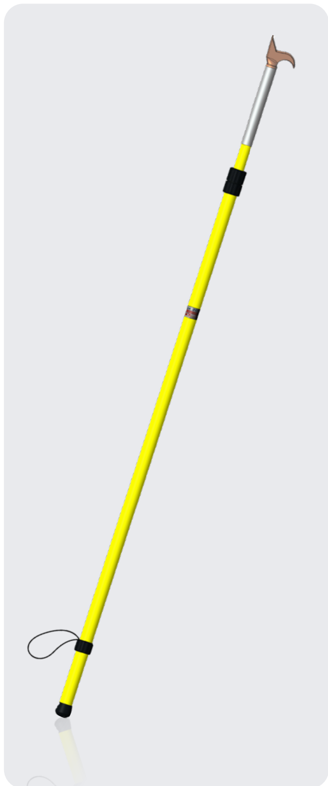
/ PIGAFCL2380GAL PERCHE ISOLANE GAFFE COUPE LATTES IEC 61235 ET IEC 60855