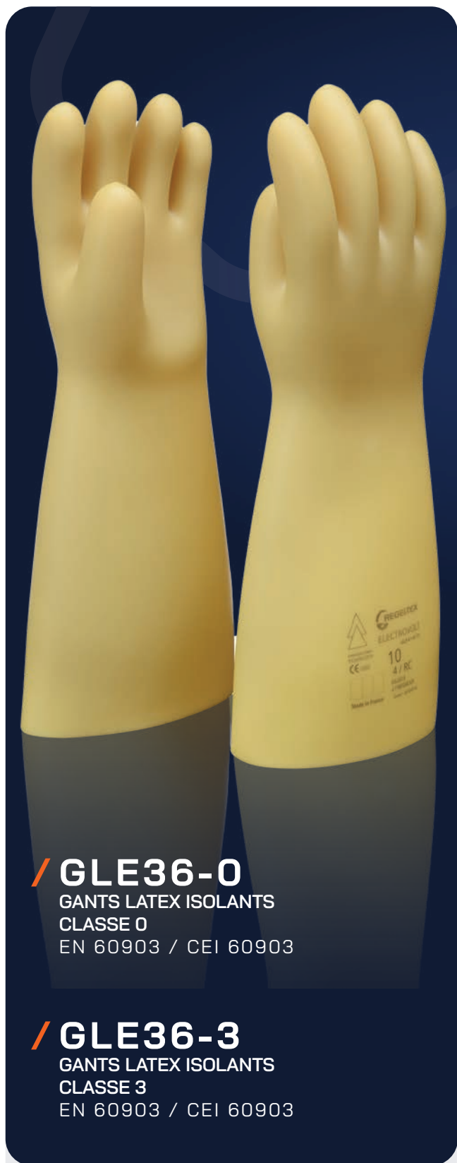
/ GLE36-0 GANTS LATEX ISOLANTS CLASSE 0 EN 60903 / CEI 60903